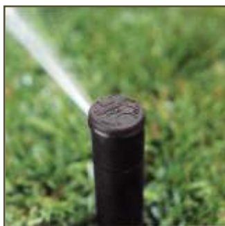
Prioritat en l'eficàcia