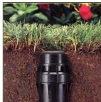
Sistemes de seguretat