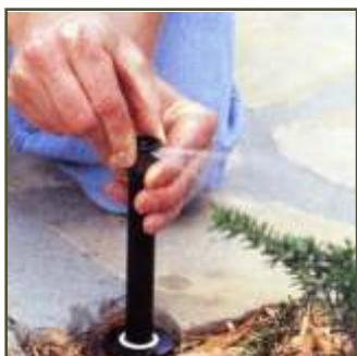
Precisió, distribució i control

Les línies de reg localitzat obtenen els millor resultat en les situacions on cal una bona gestió de l'aigua.